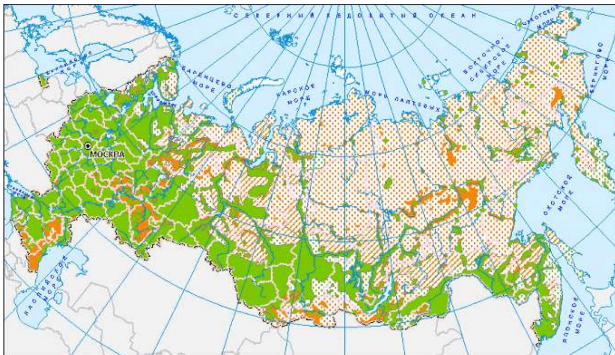
Рис.5. Расселение русских на территории Российской Федерации (зеленым показаны районы с преобладанием русских, оранжевым – с преобладанием других этносов, точками народы с редким заселением).

- Давайте посмотрим (рис. 5) на этническую карту Российской Федерации. Сплошной пояс русских территорий проходит как раз вдоль южных границ России, оставляя в своем тылу слабозаселенные территории, простирающиеся вплоть до Северного Ледовитого океана. Крупные приграничные нерусские анклавы есть только на Северном Кавказе (особенно в восточной его части) и Тыве. Остальные же внутренние этнически нерусские островки окружены сплошным массивом русского населения. Поэтому пугать, например, «немедленным отделением» Поволжья в случае создания русского национального государства весьма неразумно. Это же можно и сказать про сельские районы редконаселенной Якутии (русские в Якутии живут в городах). Поэтому внешние границы русского государства – в силу особенностей расселения русских – будут мало отличаться от нынешних границ России. Русское государство всё равно останется самой большой в мире страной. А теперь представим, что какой-нибудь нерадивый картограф прочертил границы России так, что за их пределами оказались, скажем, Тыва, Чечня, Дагестан и Ингушетия (а то и все северокавказские республики). Контуры этой карты можно было бы смело использовать в качестве российского логотипа: едва бы даже самый пристальный наблюдатель заметил бы разницу. Аппендикс и то занимает больше места в организме человека, чем эти регионы в масштабе всего русского пространства.