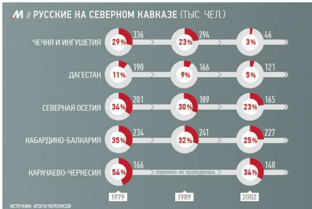
Рис.6. Сокращение численности русского населения в республиках Северного Кавказа: 1979-2002.

- С точки зрения русских национал-демократов приоритетны не границы РСФСР, прочерченные советской властью (по ее воле Северный Кавказ попал в состав России, Крым же - нет), а интересы русской нации. За последние двадцать лет русское население Северного Кавказа стремительно сократилось (рис.6), в восточной его части – Дагестане, Чечне и Ингушетии русских уже практически не осталось. Процесс оттока русских начался еще в советское время, до периода нестабильности 1990-х. Так что это не временное явление, а многолетняя тенденция: русские не хотят жить на Кавказе.