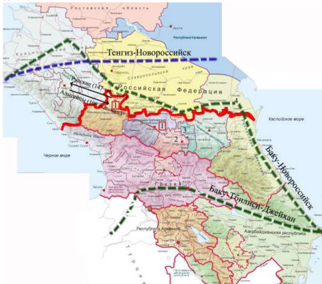
Рис.7. Предполагаемая схема размежевания с Северным Кавказом. Цифрами обозначены: (1) Черкесский протекторат (2) Северная Осетия (3) Ингушетия (4) Ногайский, Тарумовский и Кизлярский районы Дагестана. Зеленой пунктирной линией показаны нефтепроводы Баку-Новороссийск и Баку-Тбилиси-Джейхан, синей пунктирной линией – нефтепровод Тенгиз-Новороссийск. Стрелками показан возможный обмен населением между Черкесским протекторатом и территориями нынешней Адыгеи.

- Времена генерала Ермолова, когда выселяли целые аулы и заселяли освободившиеся территории казаками и русскими крестьянами, давно прошли. Сейчас другие представления о критериях цивилизованной политики. Поэтому, если мы не хотим прослыть изгоями в мировом сообществе и повторить судьбу Младича и Милошевича, о насильственных депортациях и этнических чистках надо забыть раз и навсегда. Надо действовать эффективно, но цивилизованно. Практика выселения сопряжена со слишком большими репутационными и материальными издержками: горцам дешевле предоставить независимость, чем отвоевывать у них их горы. В центральной России сотни опустевших русских сел, брошенных полей и тысячи километров никуда не годных дорог: у русской нации есть куда вложить силы и средства помимо бесполезной борьбы за клочки горной земли.